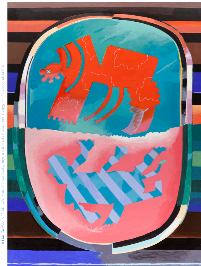
© Luis Gordillo, VEGAP, León, 2017 Volando duplex , 1972. Acrílico sobre lienzo, 180,2 x 112,3 cm. Colección ABANCA.