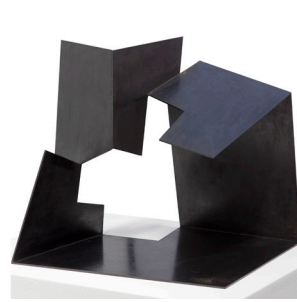
Jorge Oteiza Desocupación no cúbica del espacio, 1958-1959 Escultura de acero 391 x 55,5 x 46,6 cm Colección ABANCA

Esta exposición se completa con un lienzo de Sean Scully (Dublín, 1945) Wall of light , 1999 es una característica retícula de uno de los nombres más importantes del panorama artístico internacional. Desde los años 70, la obra de este irlandés nacionalizado estadounidense es una presencia constante en la renovación del lenguaje de la abstracción en el marco de la pintura actual. Su inclusión en esta muestra nos abre camino al arte internacional, otro de los pilares sobre los que se organiza la Colección ABANCA.