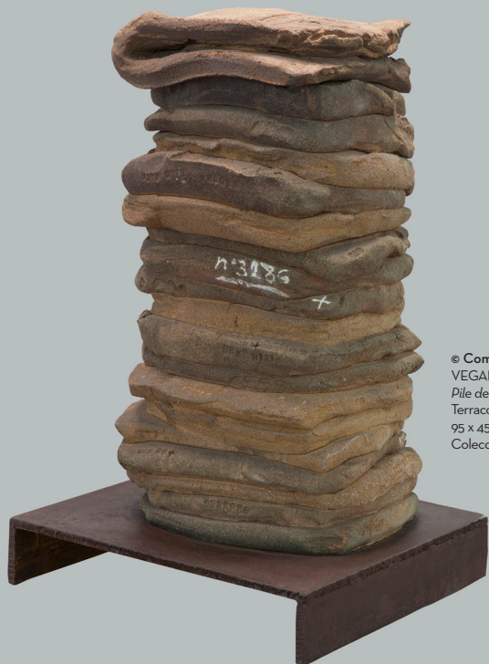
© Comissió Tàpies, VEGAP, León, 2017 Pile de sacs , 1991 Terracota 95 x 45 x 45 cm Colección ABANCA

The large sculpture by Francisco Leiro (Cambados, 1957) is, to a certain extent, the expressive counterpoint in the field of sculpture. Leiro is currently one of the most significant personalities of Spanish sculpture, being present in numerous national and international collections. Muda o cacho , 1997 is a powerful artwork made of wood and resin almost three metres tall, making it one of the ABANCA Collection’s most outstanding works.