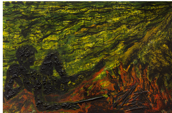
© Miquel Barceló, VEGAP, León, 2017 Le feu sur la plage , 1984 Técnica mixta sobre lienzo 199 x 304 cm Colección ABANCA